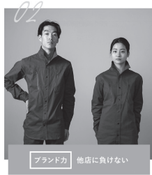
ブランド力 他店に負けない