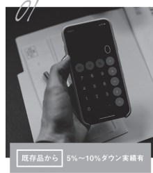
既存品から 5%~10%ダウン実績有