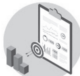
理念、ミッション、ビジョンの策定