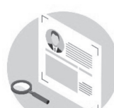
採用コンサルティング