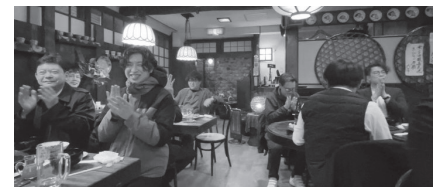
賀詞交換会の模様

今後、イベントとして小規模の交流会を毎月、全体規模の交流会を年2回、行っていく。