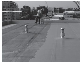
屋上塗装施工の様様

ており、弊社の技術がいろいろな方の日常の安全・安心に役立つよう、塗装をはじめ、それ以外の建設事業等を展開していき、ウイルスや物価高など日本の不景気に負けず、皆様と共に分かち合いながら仕事を楽しくやっていきたいという思いを強く持っております。どうぞ力を合わせて社会をより明るい方向へ導く1つの柱となるよう展開していきたいです。『心を塗り 思いを装う』心を大事に、仕事していきたいです。