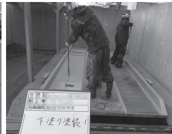
機械式立体駐車場施工の様様