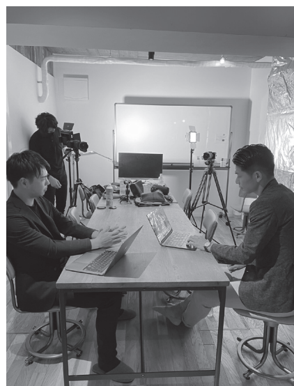
※本インタビューはYoutubeのSCMチャンネルにて動画配信しておりますので、続きは本編をご覧ください。