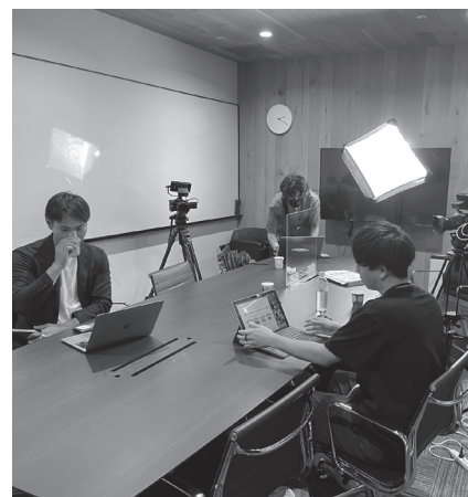
※本インタビューはYoutubeのSCMチャンネルにて動画配信しておりますので、続きは本編をご覧ください。

「そこに正義はあるのか」「人としてダサくないか」です。100人中1人がダサイと思ったら、それはダサイことなのでやらないようにしています。例えば、仮にすぐ売上が見込め、利益が立つことでもダサイと思ったことはすべてお断りしています。