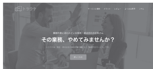
トラウケを利用するべき企業様の特徴

また自社独自システムの開発においては、システム開発会社に依頼すると通常1,000万円ほどの予算が必要なものでも、弊社であれば150万円～300万円ほどのご予算で開発可能です。ご興味がおありでしたら是非ともお申し