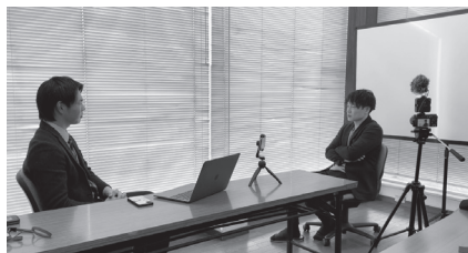
インタビューの様子