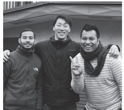
弊社日本人スタッフと外国人労働者